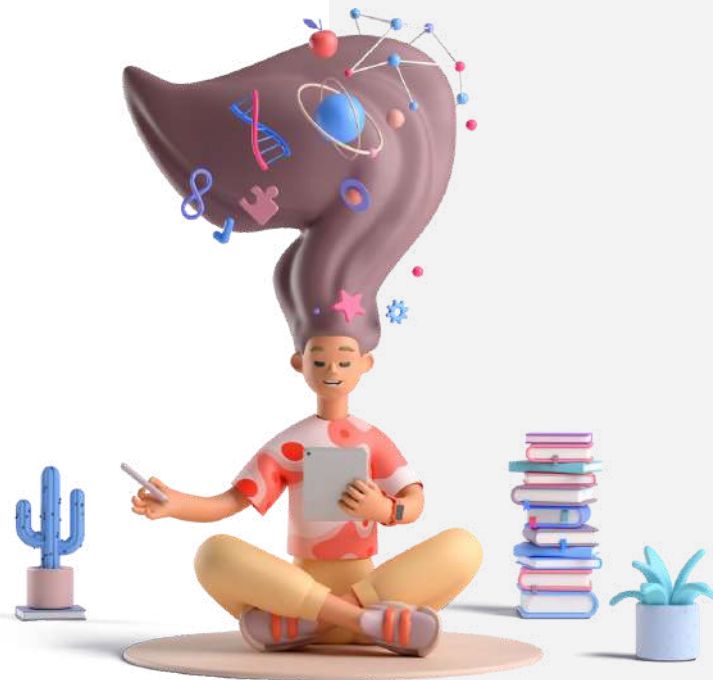
Ilustración ' Casual life 3D - Reading ' by Icons 8 Fecha actualización: Noviembre 2021